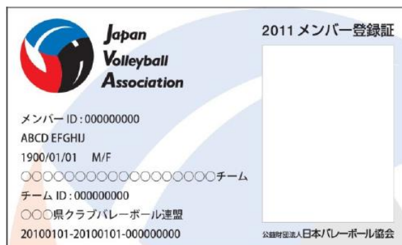
図 1 PDF 登録証のイメージ

URL: http://jvamrs.jp/pdf/nendokousin_tyukou.pdf